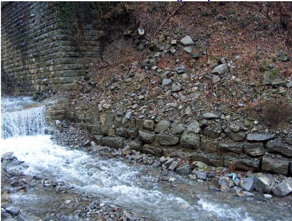
Sopralluogo del 21-02-2006