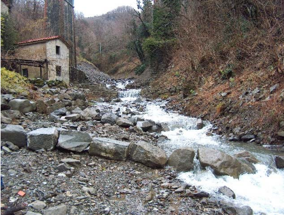
Sopralluogo del 21-02-2006