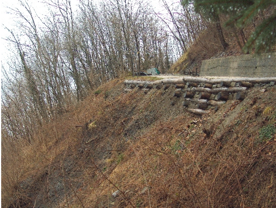
Sopralluogo del 21-02-2006