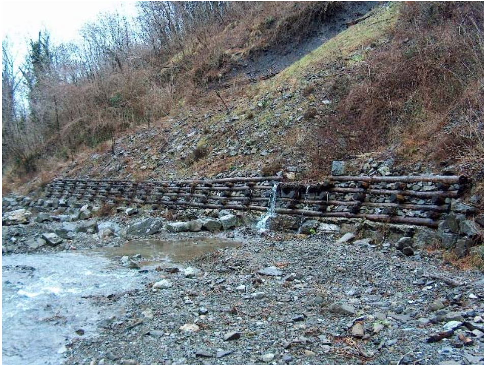
Sopralluogo del 21-02-2006