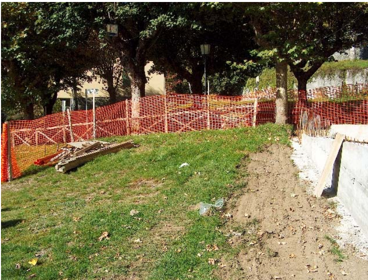
1° Sopralluogo del 18-10-2005