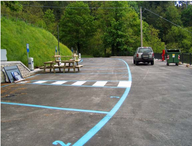
2° Sopralluogo del 11-05-2006