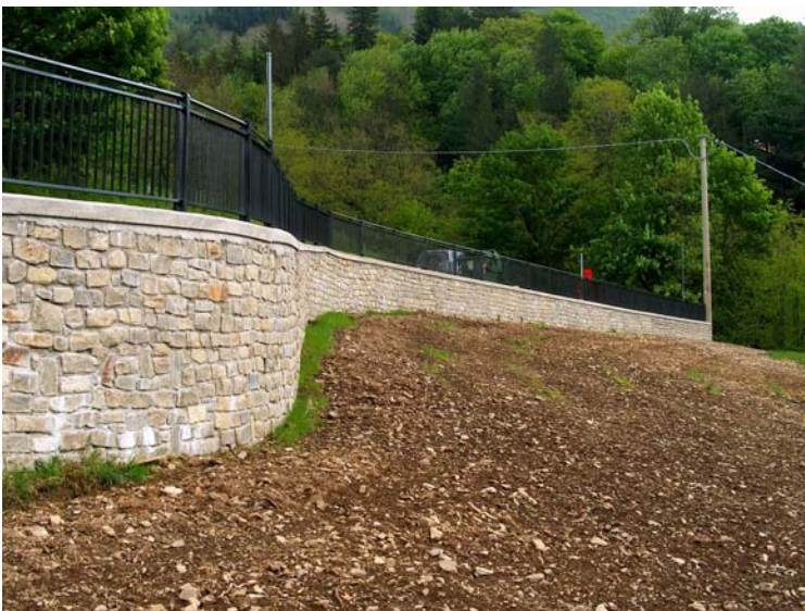
2° Sopralluogo del 11-05-2006