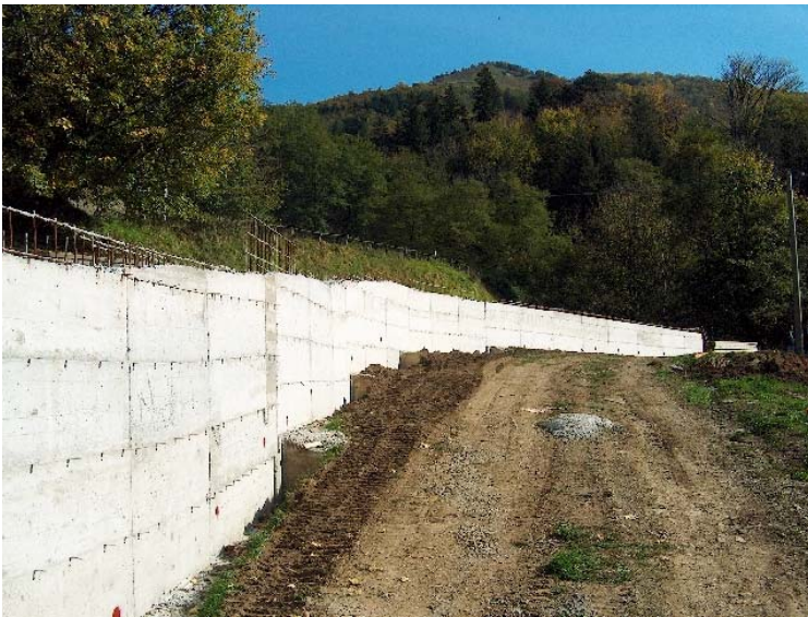
1° Sopralluogo del 18-10-2005