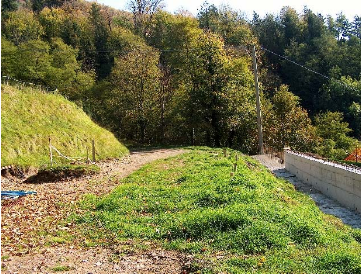
1° Sopralluogo del 18-10-2005