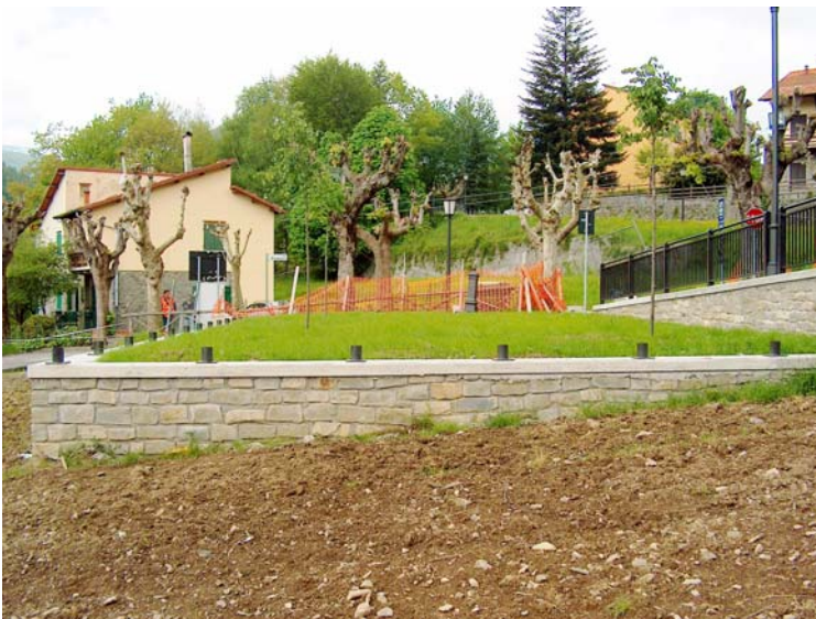
2° Sopralluogo del 11-05-2006