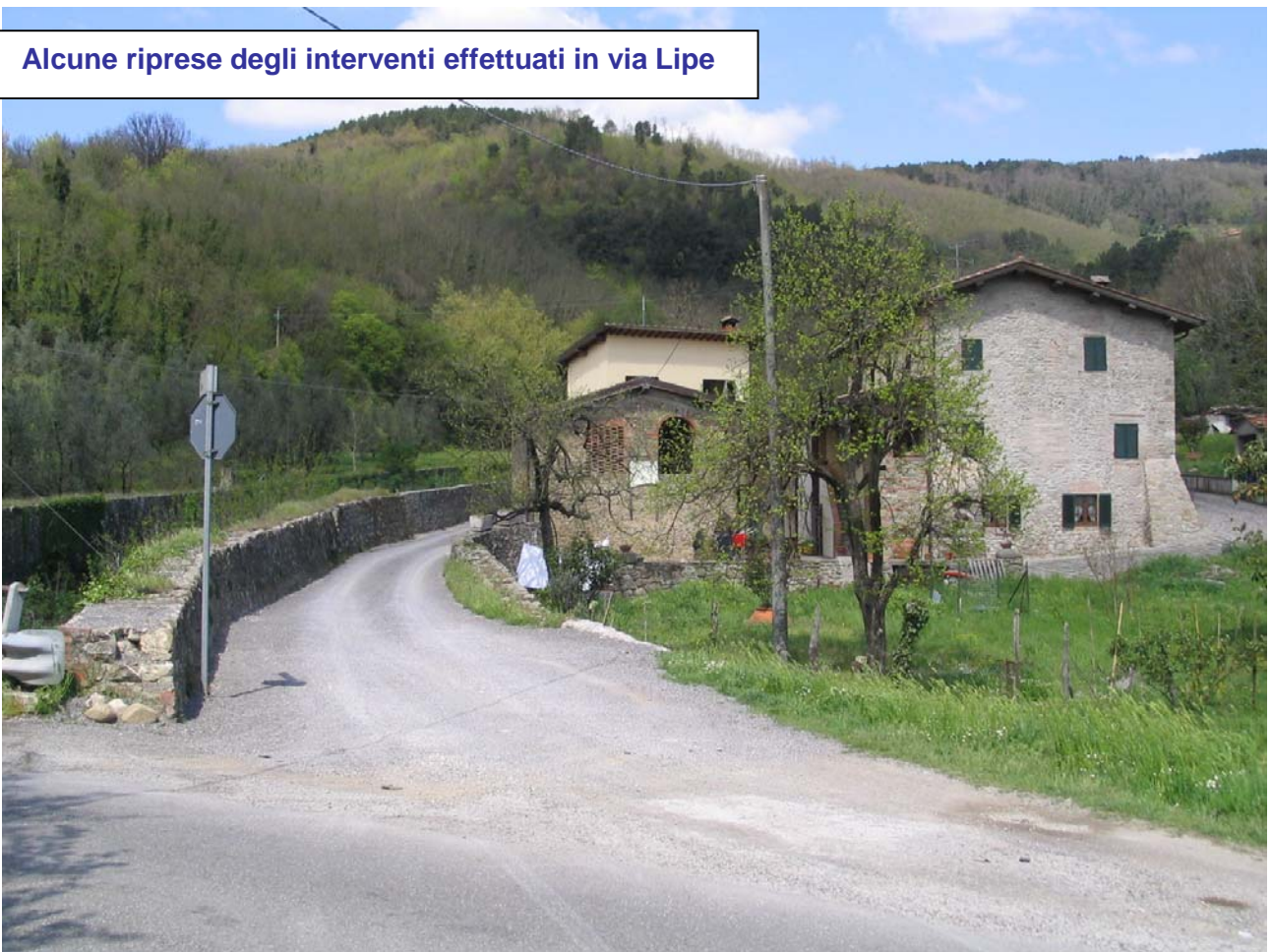
Alcune riprese degli interventi effettuati in via Lipe

Le opere consistono in alcuni interventi di allargamento della sede stradale in alcuni tratti della via, con relativa risagomatura di scarpate, rifacimento dell'asfalto e dei fossetti laterali.